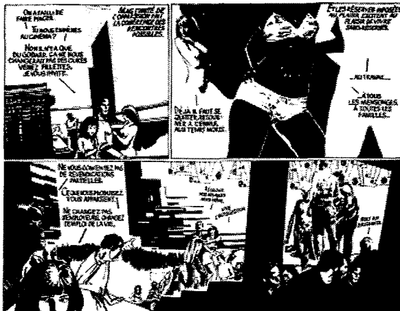
CHANGEMENTS DE SITUATION. POUR EN SAVOIR PLUS LONG SUR VOS PROJETS, POUR RECEVOIR GRATUITEMENT VOS PROCHES, LIREZ LA REVUE 'INTERNATIONALE SITUATIONNISTE' ALORS QU'IL Y A DES PARAIRES, BOITE POSTALE 309/03 PARIS.

(1) In 1908 scheurde de IWW in de Verenigde Staten uiteen in een 'Chicago'-factie, geleid door 'Big Bill' Haywood en Vincent St. John, een 'Detroit'-factie, geleid door Daniel de Leon. De Zuidafrikaanse IWW was met de eerste, de Socialist Labour Party met de tweede verbonden. - (2) The International , 16 juni 1916, 'Inviting Jim Sixpence to tea'. - (3) The International , 19 oktober 1917: 'The Pass Laws: organise for their abolition'. - (4) Politierapport over de IWA, mei 1918 (?), in het dossier van het Departement van Justitie, 3/527/17, Nationaal Archief, Pretoria. - (5) F.A. Johnstone, 'The IWA on the Rand: socialist organising amongst black workers on the Rand 1917-18', in: B. Bozzoli (ed.), Labour, townships and protest ; Ravan, Braamfontein 1979, p. 260. - (6) Politierapport over de IWA, als boven geciteerd. - (7) P.L. Wickens, The Industrial and Commercial Workers' Union of Africa ; Oxford University Press, Kaapstad 1978, p. 27.